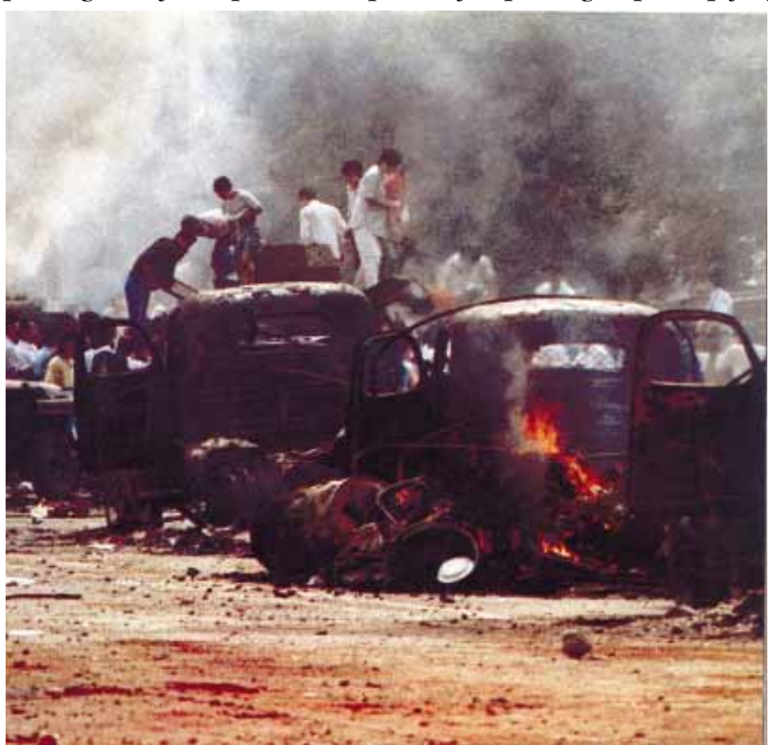
INCIDENT ILI POKOLJ NA TIENANMENU: Građani Pekinga na izgorjelim vojnim vozilima i automobilima

Zbog takve prijateljske gospodarskim matom, Bush je nedavno izvršio pritisak na taj-