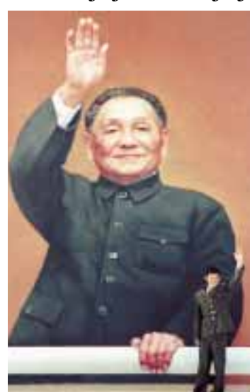
DENG XIAOPING: Zaborav će prekriti Tienanmen

na, Kina postupno postala riznica svjetskih strahovanja i nada, ponekad inspirator geopolitičkog napretka, ponekad izgovor za tuđe gospodarske nedaće. Amerikanci vjeruju da im zbog kineske konkurencije, pa i zbog vezivanja kineske podcijenjene valute uz (također podcijenjen) dolar, padaju plaće i nestaju radna mjesta. Štoviše, da Kina, time što ostvaruje golemi višak u razmjeni sa SAD-om (veći od sto milijardi dolara) i ulaganjem tog viška u američke obveznice, zapravo u svojim rukama drži američki gospodarski oporavak.